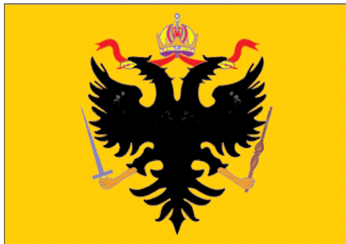
Aquila dello stemma del Sacro Romano Impero

sionari cristiani del XIX secolo venuti a contatto con i nativi americani durante l’opera di conversione, giusto per avere qualcosa di concreto su cui concentrarsi nel combattere lo sciamanesimo come pratica pagana o di riscuotere un consenso esterno per essere autorizzati a contrastarlo. Nel secolo scorso il presbitero antropologo australiano A.P. Elkin (1891–1979) ha individuato quattro forme di totemismo: individuale ; sociale (legato a una famiglia, un ramo, una sezione o sottosezione di famiglia, o a un clan matrilineare o patrilineare); culturale , con un contenuto religioso di tipo patrilineare e concettuale nella forma; onirico , il cui contenuto totemico è nei sogni e di stampo sociale o individuale. Invece lo studioso francese Claude Lévi