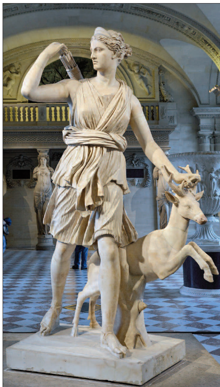
Diana di Versailles