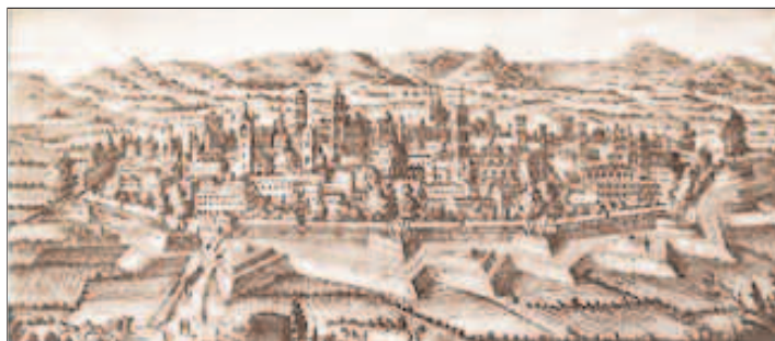
La Città di Lucca, capitale di quella Repubblica