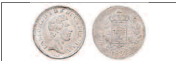
2 Lire di Carlo Ludovico di Borbone