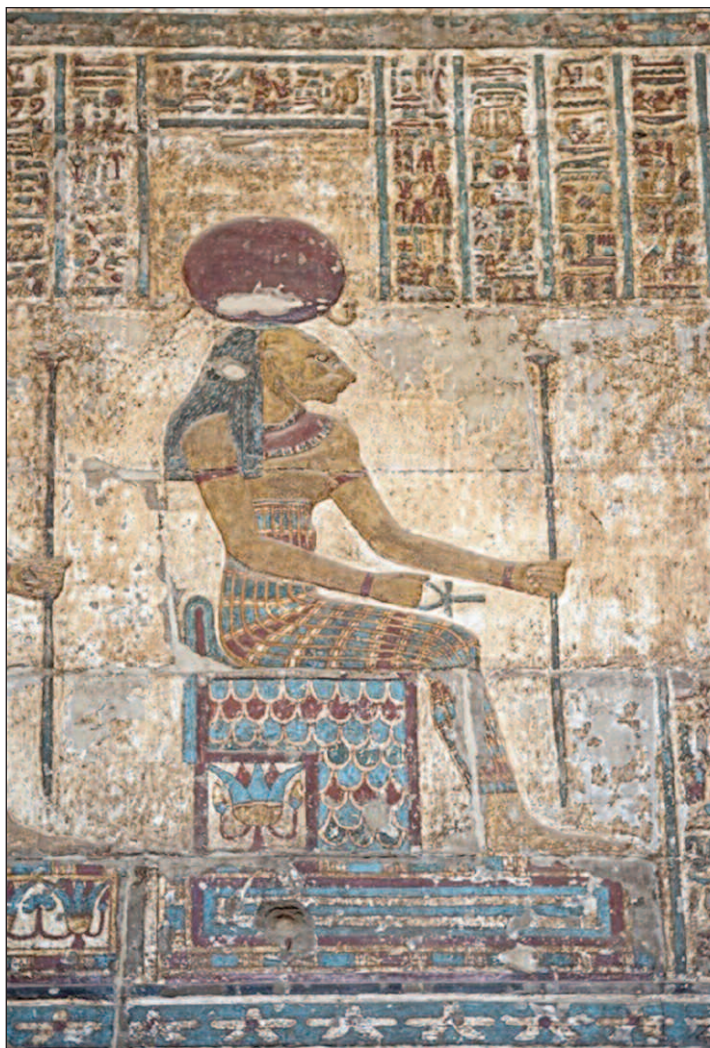
La Dea Leonessa Sekhmet

il pericolo. Inoltre nei culti sciamanici, il totemismo si avvicina al concetto di “possessione volontaria” poiché i praticanti di queste discipline primitive entrano in un contatto così profondo con lo “spirito” dell’animale totem da esserne “soggiogate” e prenderne atteggiamenti, abitudini e abilità.