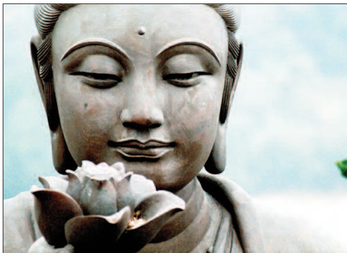
Fiore di Loto