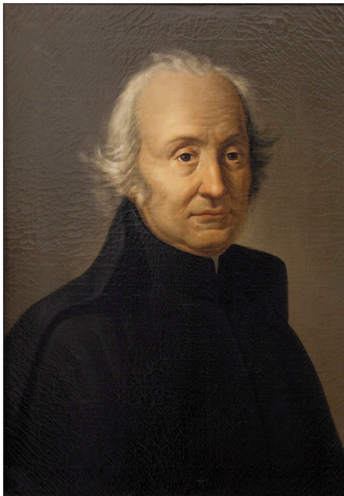
L'astronomo Giuseppe Piazzi in un ritratto di Costanzo Angelini

1.° Tra le massime distanze, orientale cioè ed occidentale, di Venere dal Sole, allorchè essa ritrovasi tra il Sole e la Terra, il di lei crescente illuminato presenta una maggiore luce verso il lembo esteriore, la quale non solo nel mezzo, ma vicino all'estremità ancora, gradatamente e con regolare progressione va decrescendo verso l'interiore, ove finisce e si perde in un fosco debolissimo azzurro il di cui termini formano un margine irregolare, indefinito, mal terminato il quale appena coi migliori telescopi si giunge a