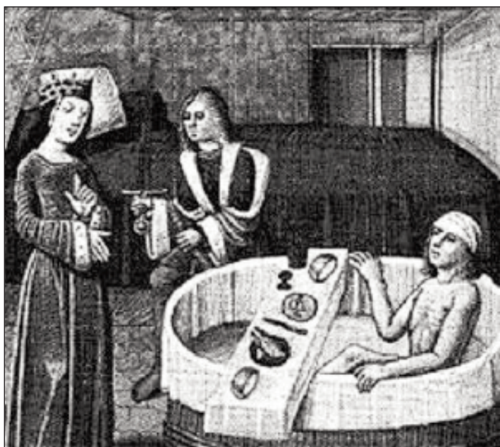
Il bagno in un'immagine del 1494-1495