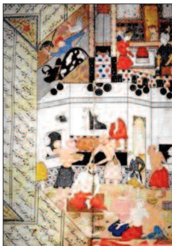
Bagno turco, 1400

dai pozzi per versarla nella botte. Per questo il bagno era fatto raramente ma c'era comunque la voglia di lavarsi. In ogni caso l'acqua nella botte veniva utilizzata da tutti i membri della famiglia. Pare comunque che nel Medioevo la gente fosse abbastanza ac-