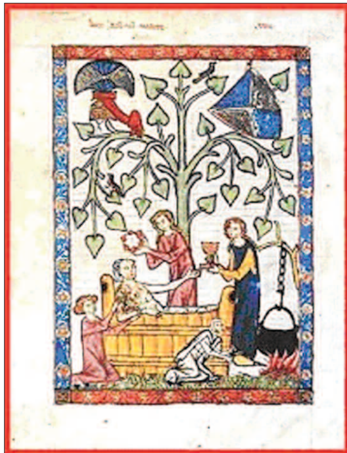
Miniatura del Codice Manesse, 1300

rico in cui la gente non si lavasse mai. Anzi, spesso, come testimoniano fonti del periodo, per le classi più abbienti il bagno era quasi un rituale. La persona veniva immersa in un catino imbottito di stoffa pregiata, pieno di erbe aromatiche sparse nell'acqua. Questo avveniva per coloro che avevano servitori a disposizione, quindi erano ricchi possidenti. Il bagno durava un po' di tempo e ci si lavava con spugne morbide. Seguiva il risciacquo con acqua tiepida e profumata alle rose. L'immersione era nota con il termine di "stufarsi" e era in uso a ogni ceto sociale. Durante i viaggi i signori portavano tutto l'occorrente dietro e avevano al seguito un servitore che si occupasse del bagno. In estate il catino era posto all'esterno, in inverno accanto al camino. L'acqua veniva riscaldata con il fuoco stesso della legna arsa appositamente per quello scopo. La gente più povera che non poteva permettersi di scaldare l'acqua, rimandava il lavaggio alla stagione calda. I bambini e i neonati venivano lavati spesso in un piccolo catino con acqua pulita. Chi si poteva permettere una vasca e servitori a dispo-