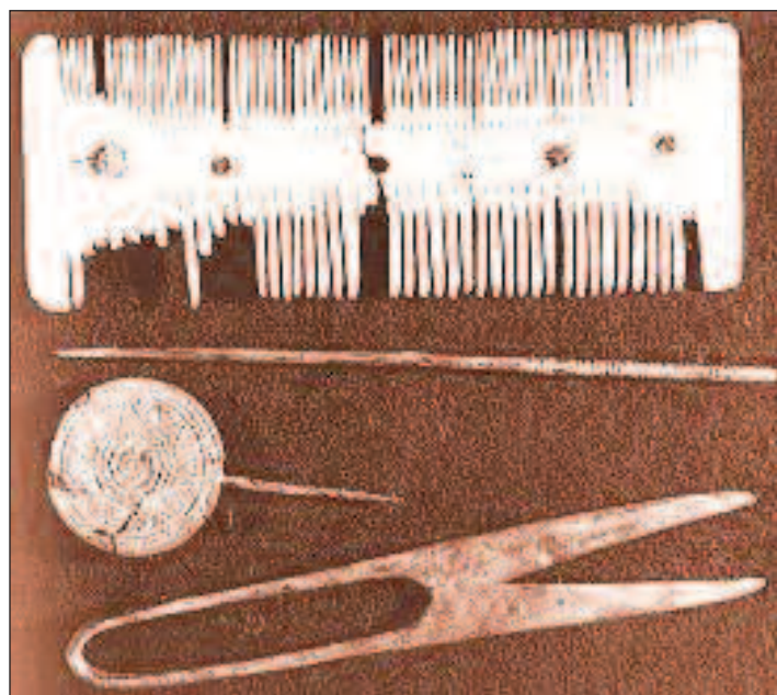
Pettine d'osso, cesoie e ornamenti per capelli