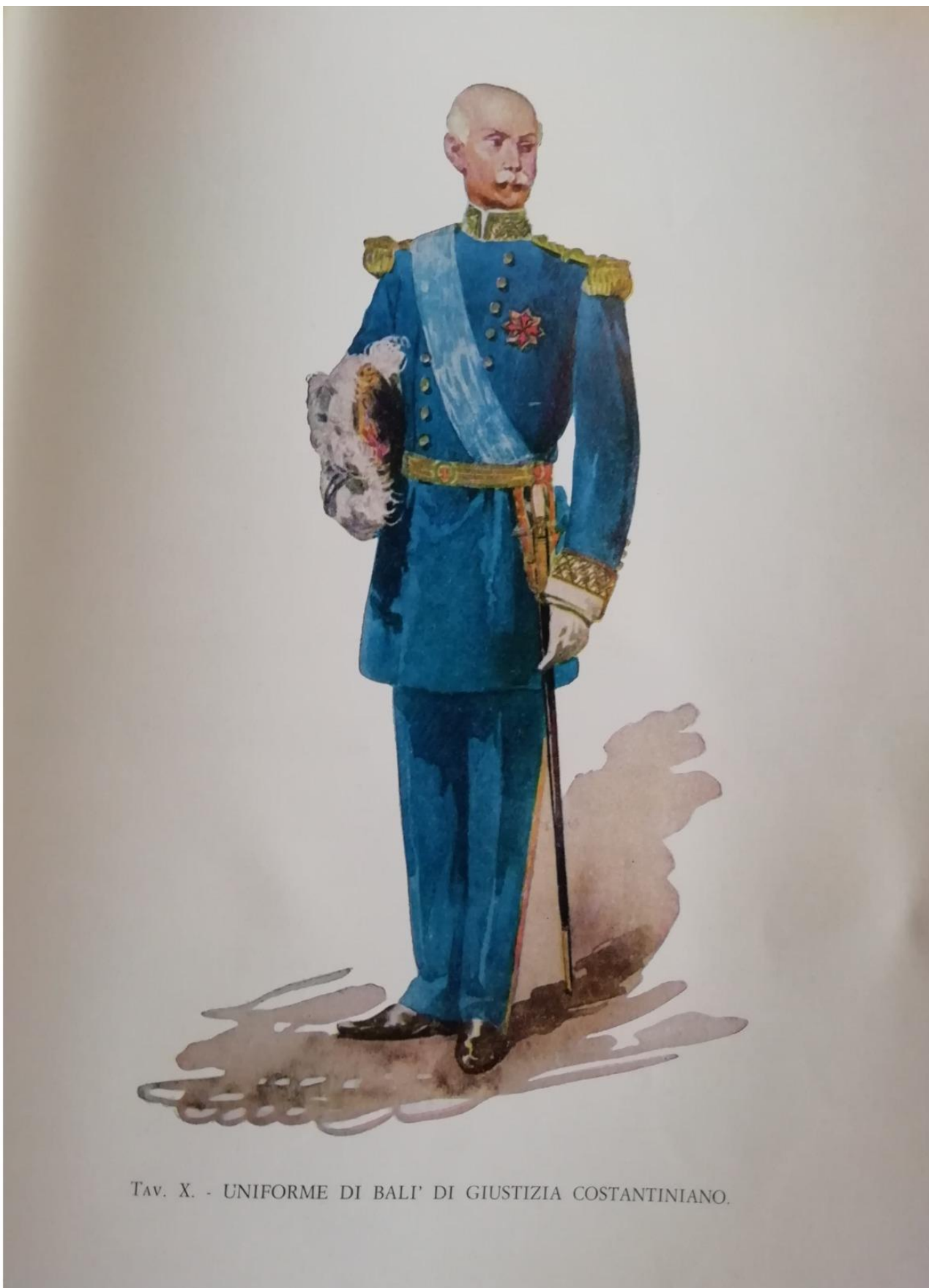
Tav. X. - UNIFORME DI BALI' DI GIUSTIZIA COSTANTINIANO.